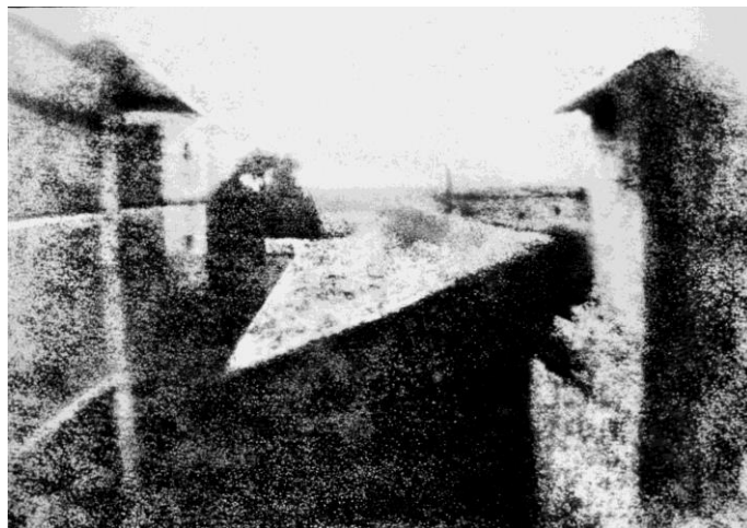
Fotoğraf 1: Joseph Nicéphore Niepce, "View from the Window at Le Gras"

19. yüzyılda insanlık, farklı zaman dilimlerinde gözlerinin önünde olan imgeleri, ışığa karşı etkileşimi olduğu anlaşılan gümüş tozlarıyla kimyasal etkileşime sokarak görünür kılmaya çalışmıştır. Bunun sonucunda Camera Obscura adı verilen karanlık bir kutu geliştirilmiştir. Bu şekilde gerçeğe en yakın görüntü elde edilmeye çalışılmıştır. 1813'te Fransa da Joseph Niepce, ışığa duyarlı bir levha üzerinde kalıcı görüntüler elde etmeyi başarır, fakat görüntüyü elde etmek için sekiz saat veya üzerinde pozlaması gerekmiştir.